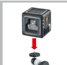
Filetto di 1/4"