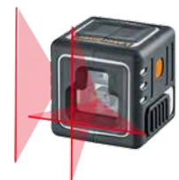
CompactCube-Laser 3 + pile

Dimensioni confezione (L x A x P) 175 x 220 x 138 mm