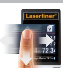
Display touch per la commutazione delle funzioni