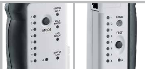
Assegnazione dei singoli conduttori in cavi di rete LAN

CONDIZIONI DI CONSERVAZIONE -10 ... 60°C, umidità dell'aria max. 80%