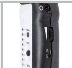
Volume del segnale di prova regolabile