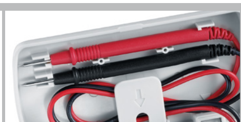
Supporto per puntali di misura