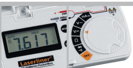
Ampio display LC