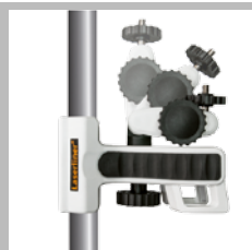
Regolabile e con diverse possibilità di fissaggio