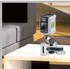
FlexClamp Plus con supporto