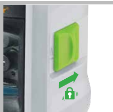
Bloccaggio pendolo per sicurezza di trasporto