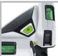
Livelle per la prerogolazione dell'apparecchio