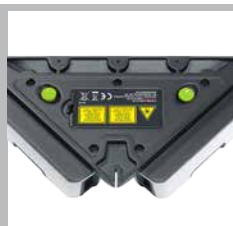
Bordi di contatto e superficie di appoggio